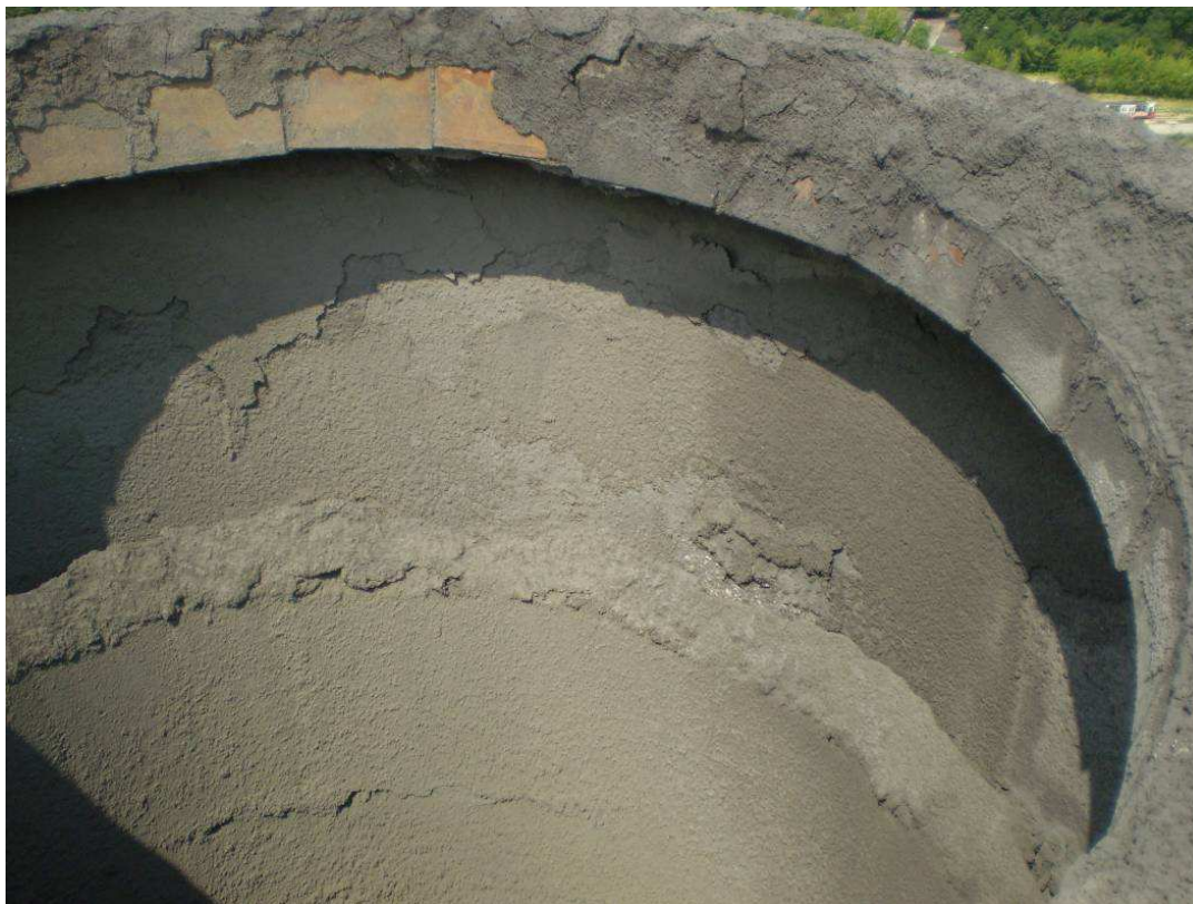
Rys. 3. Obniżenie się przewodu żaroodpornego względem trzonu o około 1,3 m w wyniku utraty stateczności miejscowej płaszczka