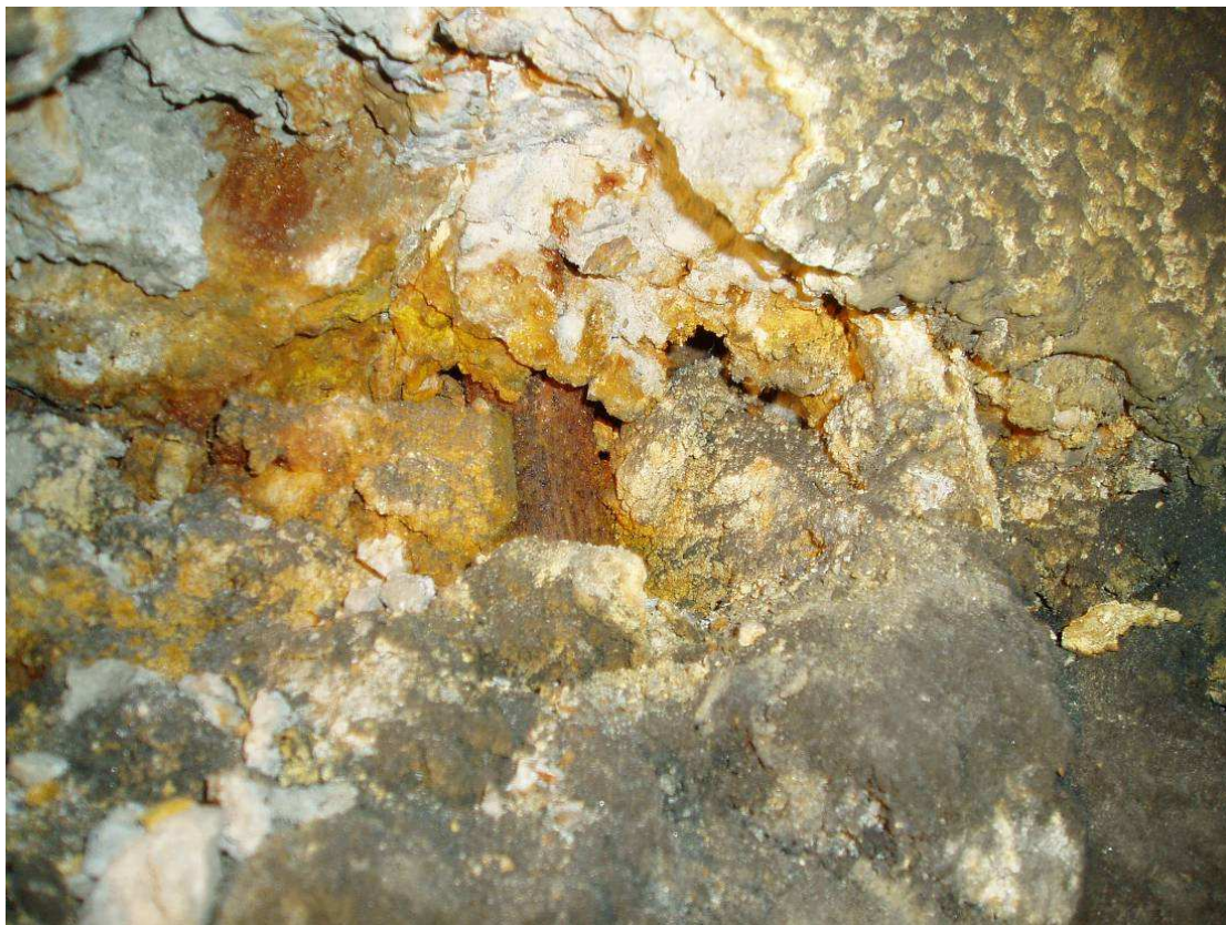
Rys. 5. Degradacja żarobetonu na wewnętrznej powierzchni przewodu