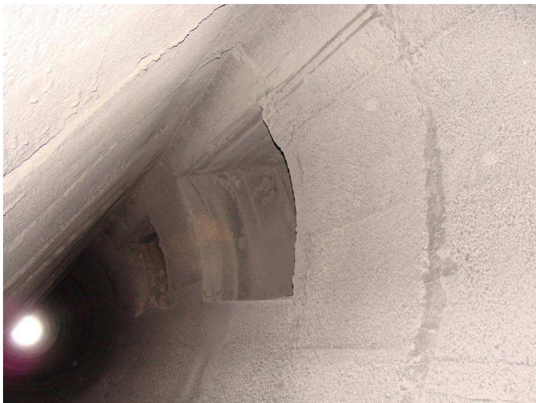
Rys. 4. Wzmocnienie uszkodzonego przewodu żarobetonowego w strefie otworów wlotowych za pomocą powłoki z betonu żaroodpornego