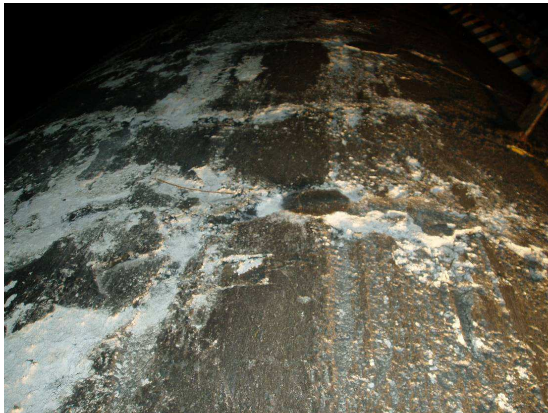
Rys. 6. Uszkodzenia korozyjne żarobetonu na zewnętrznej powierzchni przewodu