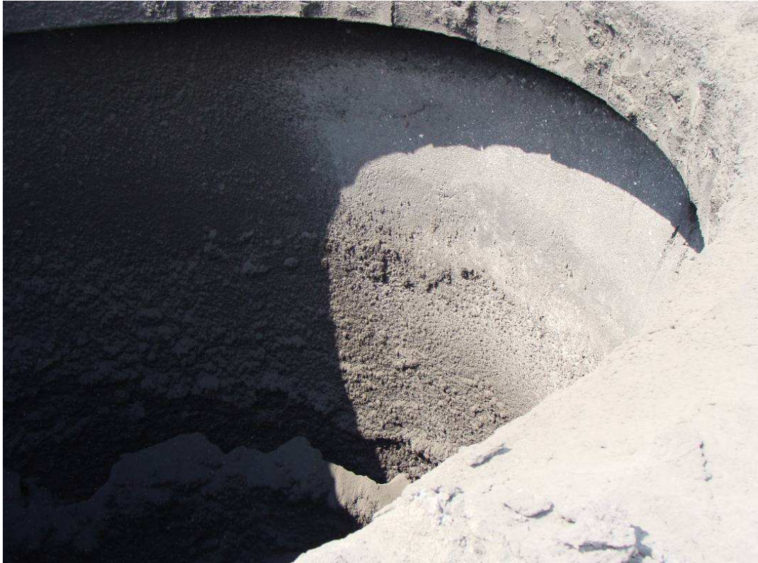
Rys. 1. Obsunięcie się przewodu żarobetonowego względem trzonu żelbetowego o 3 m, w wyniku lokalnej utraty stateczności powłoki przewodu